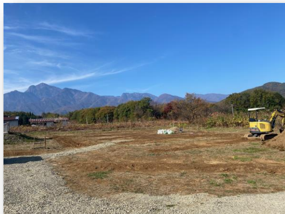
甲斐駒先端研究センター建設の様子

今後も試験・評価機能の充実を目指し、時代にあった新しい分野への参入、新しい評価方法の開拓を積極的に行っていきます。