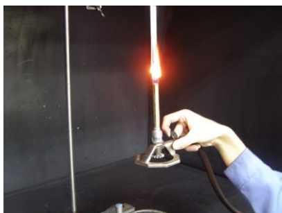
UL94 V 燃焼性試験

長年の実績と経験に基づき、信頼性の高い高品質のデータを、短納期にて提供させていただきます。試験実施にあたってのご相談や、試験の立会いも随時受け付けております。燃焼試験に関してお困りのことがありましたら、まずは一度ご連絡ください。