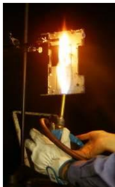
IEC/UL60950-1 Annex A.1 試験

上記以外の試験につきましても、対応可能か検討させていただきますので、まずは一度お問い合わせください。また各種予備試験でしたら、必ずしも規格に準拠した方法でなく、お客様のご希望に沿った試験も承っております。規格の一部を変えて試験したい、数量を増やして試験したい、といったご要望の際も、お気軽にご相談ください。