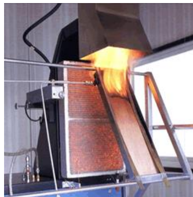
ラジアントパネル試験