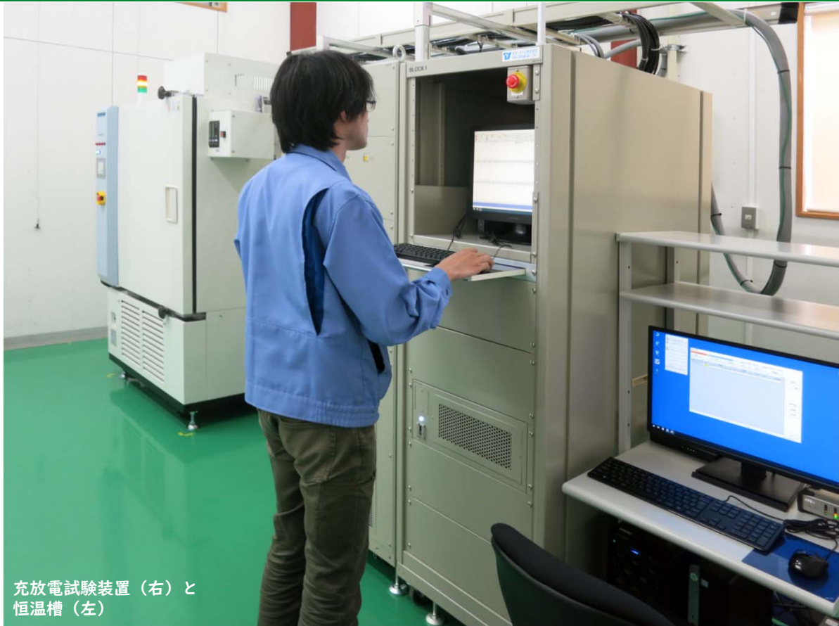
充放電試験装置（右）と 恒温槽（左）

低炭素社会の実現に向けて、世界中で普及の進む電気自動車（EV）や、太陽光発電などの再生可能エネルギーをより効率的に運用する自家消費システムの需要が拡大し、蓄電ツールとしては大容量のリチウムイオン電池が主流となっています。そこで、海外製のリチウムイオン電池がシェアを大きく伸ばしている中、ケミトックスではそれらの性能と品質を適切に評価するため、新たにリチウムイオン電池の試験・評価サービスを行っています。