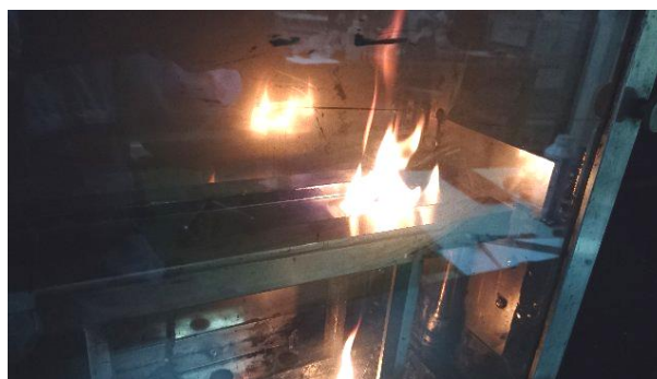
FMVSS 302 燃焼試験の様子