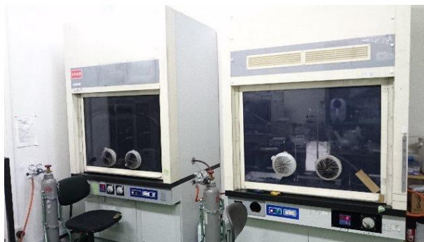
FMVSS 302 燃焼試験用ドラフト

FMVSS 302 燃焼性試験は、乗用車、トラックおよびバスの室内に使用される内装材に発生する火災を想定した試験です。ケミックスでは昨今の FMVSS 302 燃焼性試験のニーズの高まりにお応えして、よりスピーディな評価が行えるよう、設備拡充を行いました。3 セットの FMVSS 302 試験用サンプルホルダーを用意し、これまで以上に多量の試験サンプルについて、短納期でのデータ提出が可能です。