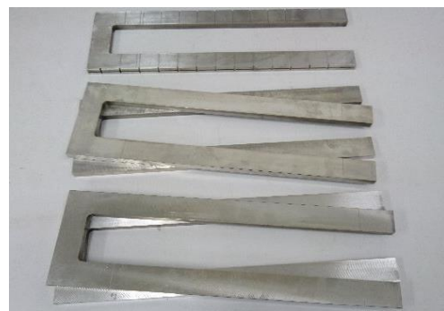
FMVSS 302 燃焼試験用サンプルホルダー