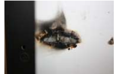
インターコネクトの接続不良による燃焼痕

ケミトックスでは、I-V 特性、EL 検査、ホットスポット、漏れ電流、架橋率、温度計測などでモジュールの不具合を確認後、SEM/EDX、断面観察、IR、ICP-MS、原子吸光分析などの様々な化学分析装置を利用して不具合箇所の特定を行っております。