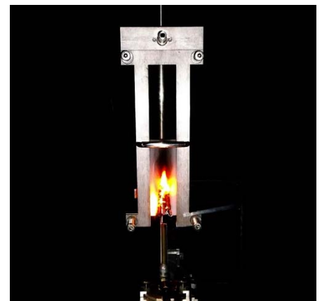
FAR 25.853 Appendix F 垂直燃焼試験

機体メーカーの正式認証のための試験については、試験プログラム策定能力を持つ DERを擁する北米の試験所とタイアップ して、どのような試験を実施すればよいのかといった事前のご相談から、試験レポートの発行までトータルサポートをご提供いたします。