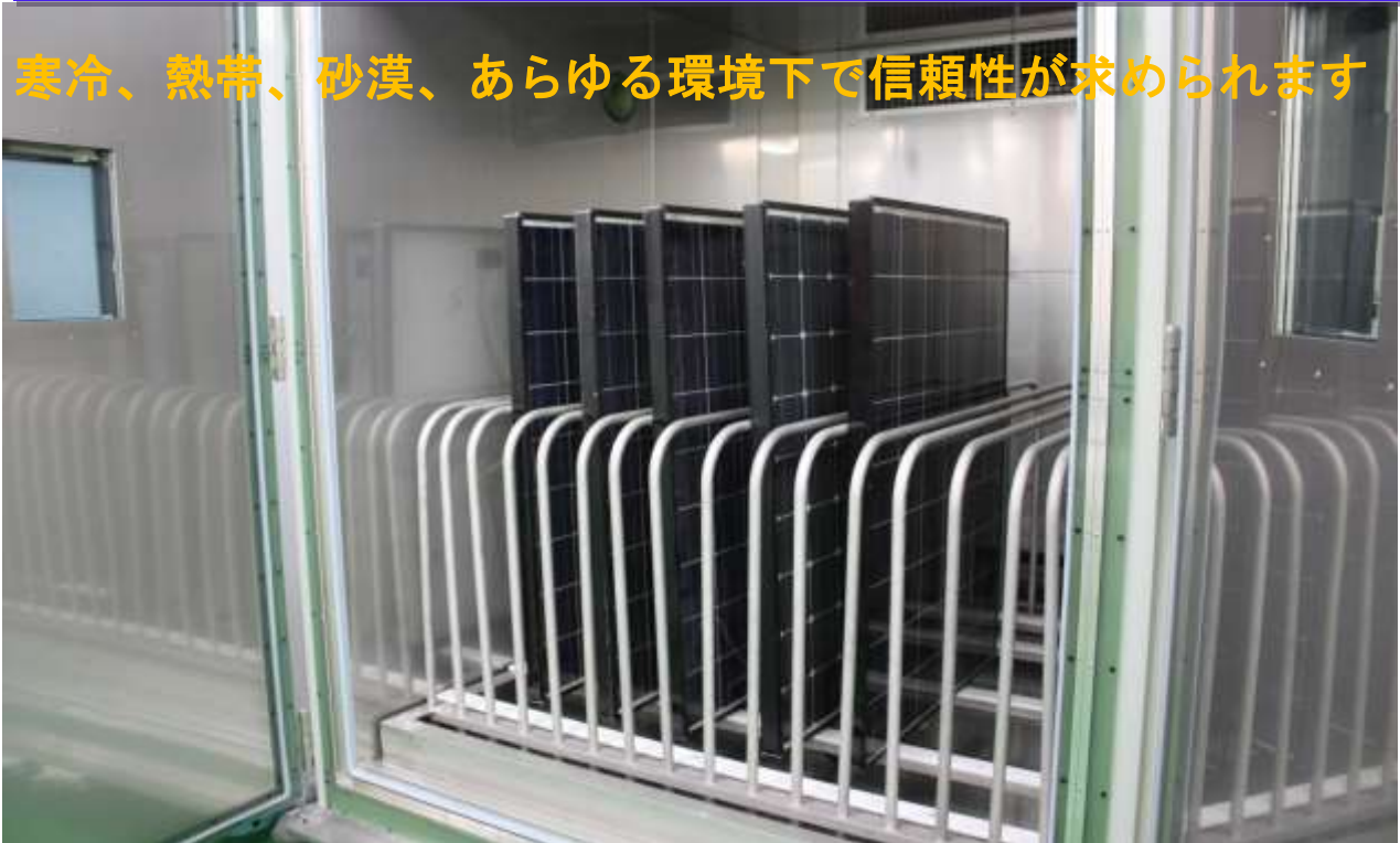
環境試験用大型チャンバー (W1500 x H2000 x D2000 (mm))