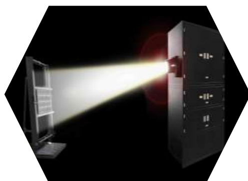
塩水噴霧後の最大出力測定