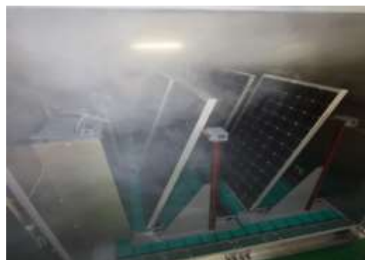
塩水噴霧中の状況

ケミトックスでは、これらのシーケンスに示されるすべての試験を行っております。またフルモジュールの試験が可能な大型試験槽および材料評価に適した小型槽を所有しており、様々なサンプルサイズ、形状に対し対応可能です。貴社の研究・開発、ユーザーへのデータ提示など、様々な目的・用途に弊社評価試験を是非ご利用下さい。